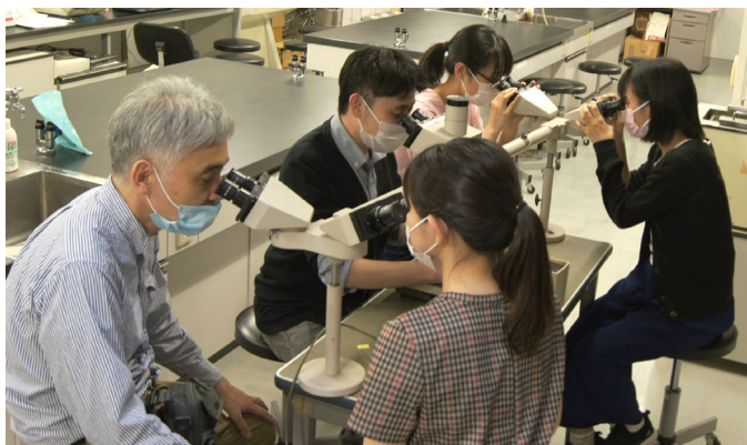
顕微鏡実習の様子