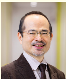
森ノ宮医療大学 副学長 森ノ宮医療大学大学院 保健医療学研究科 保健医療学・医療科学専攻長