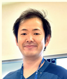
大阪国際がんセンター リハビリテーション科 理学療法士