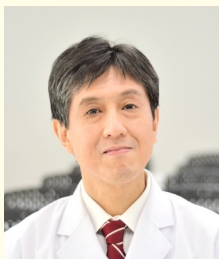
森ノ宮医療大学大学院 保健医療学研究科長